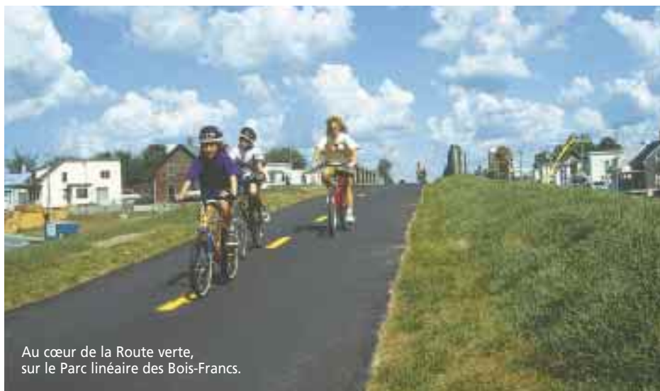
Au cœur de la Route verte, sur le Parc linéaire des Bois-Francis.

Il est certain que la mise en place de ce programme marque un tournant dans le développement de la Route verte. Le gouvernement du Québec réaffirme l'importance qu'il accorde au développement de